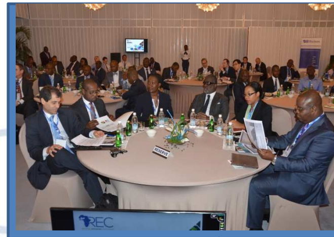
Table des premiers intervenants (AfDB, CREPMF, HUDSON et BRVM)