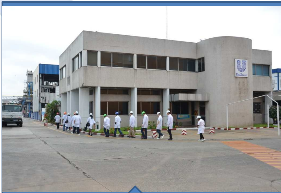
Visite d'usine: UNILEVER