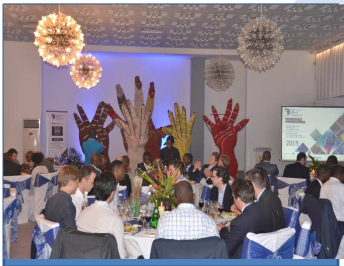
Spectacle diner gala