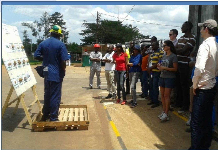
Visite de plantation: SAPH