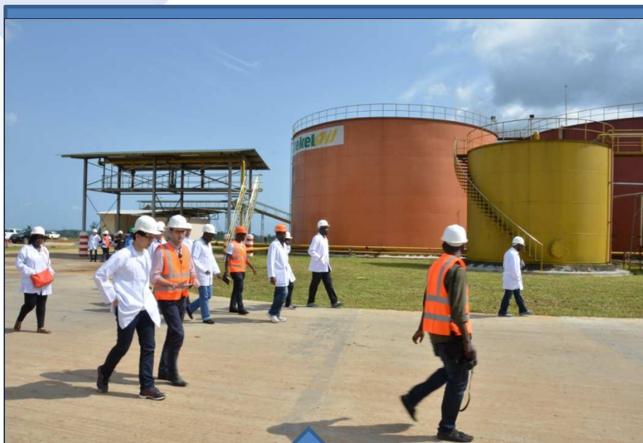
Visite de plantation: DEKEL OIL