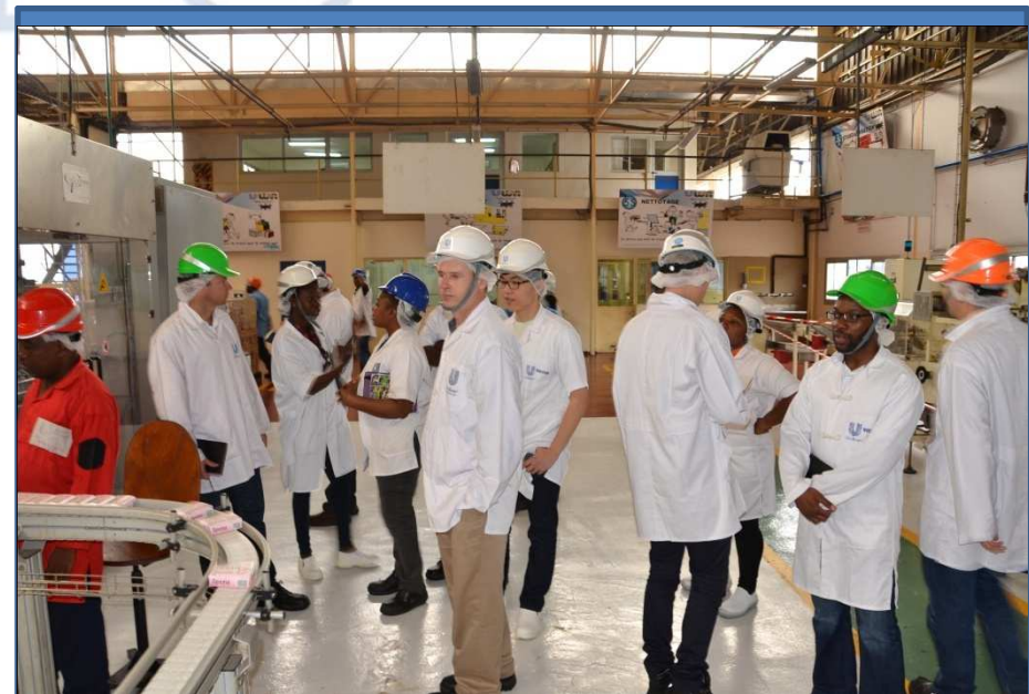
Visite d'usine: UNILEVER