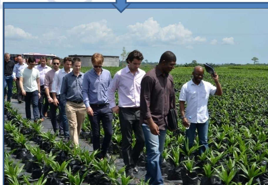
Visite de plantation: DEKEL OIL