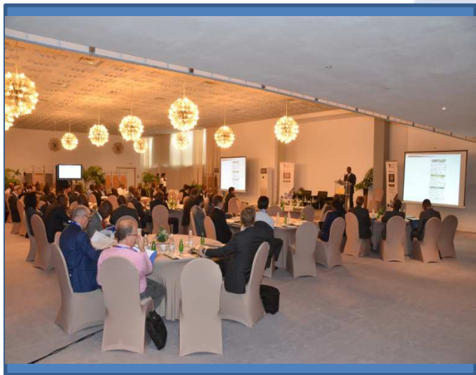
Vue d'ensemble de la salle plénière