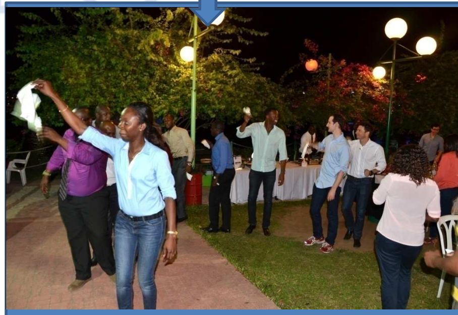
Sortie - détente Réjouissances au débarcadère