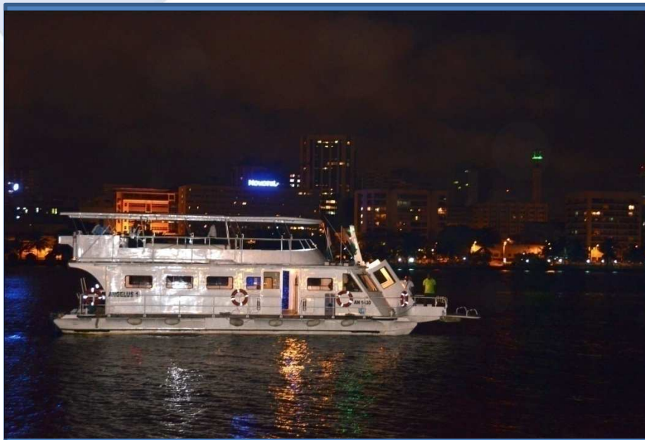
Abidjan by night Balade lagunaire à bord de l'Angelus