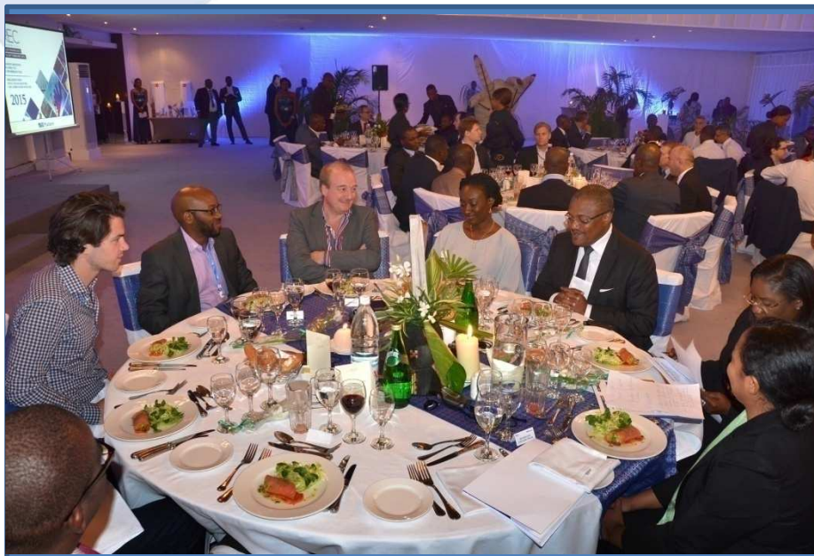
Diner gala Une Vue des convives