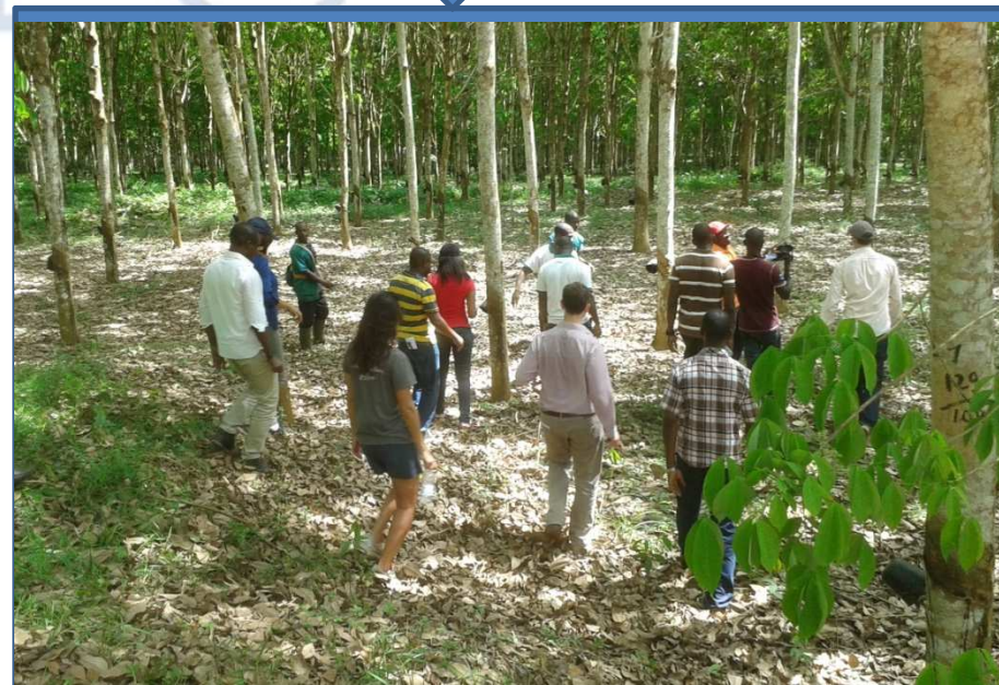
Visite de plantation: SAPH