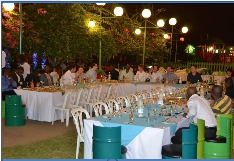
Sortie - détente Diner au restaurant le débarcadère