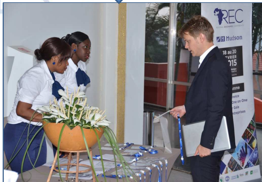
Hall du Sofitel Abidjan Hotel Ivoire Enregistrement et remise de badges participants